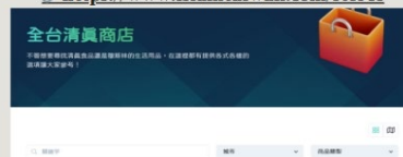
照片說明：學生 B 編輯外籍食物線上購買資訊