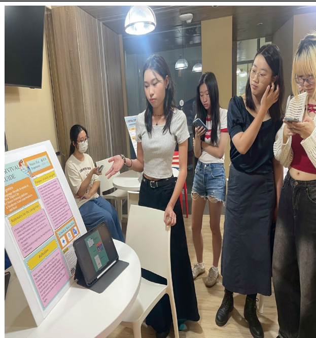
照片說明：學生口頭報告，同學聆聽