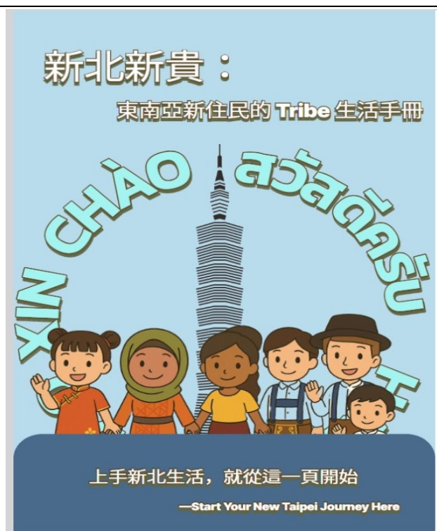
照片說明：學生 A 作品封面