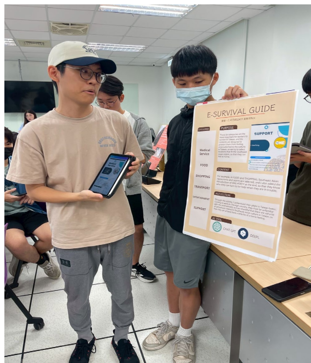
照片說明：學生口頭報告，同學聆聽

計畫執行期間如有特色的活動或值得分享的回憶，可附上照片並在下方說明(此為選項)。