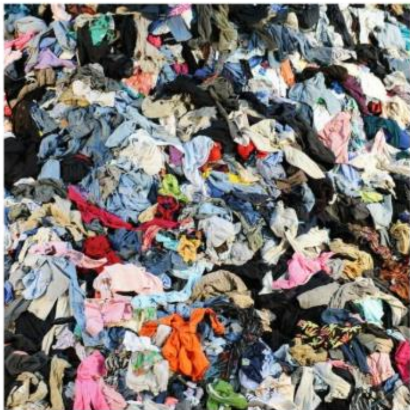
圖 16 廢棄衣服堆示意圖