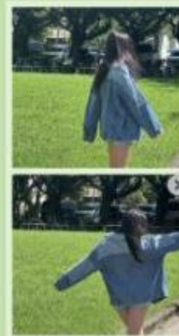
圖 26 滑動式圖片貼文

因為辦公室冷氣有時候滿冷的哈哈 如果外面太陽很大的話,同時也能防曬~ 那麼完成我們的穿搭後就可以出門啦!