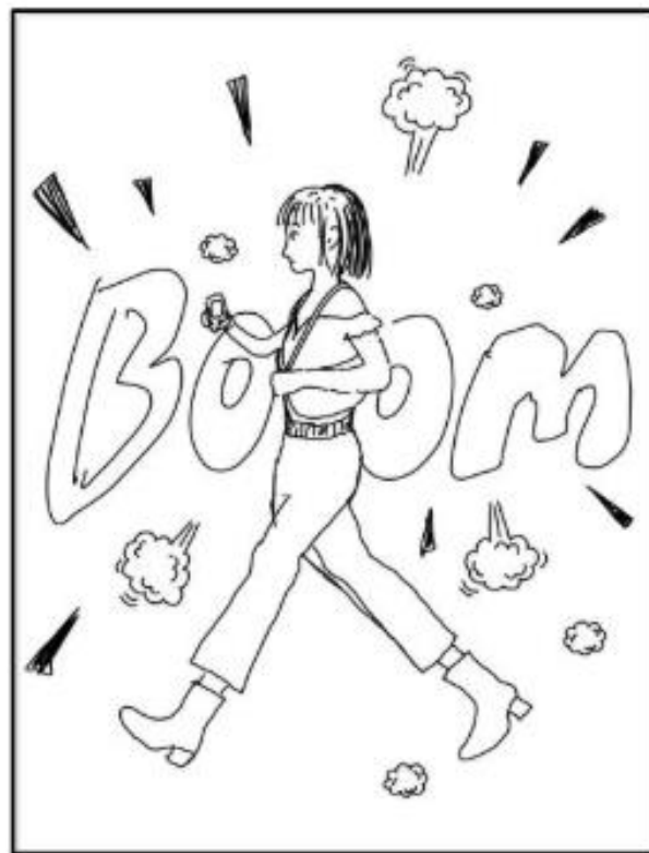
圖 17 海報發想示意圖