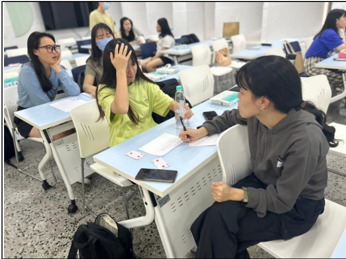
互相對各自的問題進行訪問