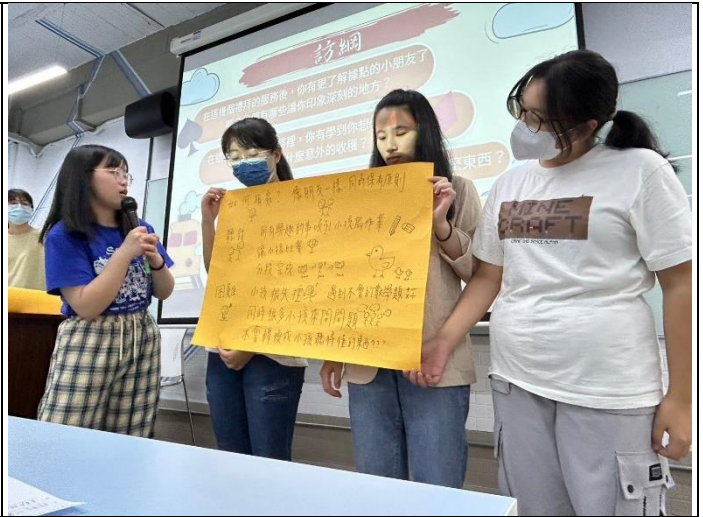
各組同整回覆後進行新聞播報