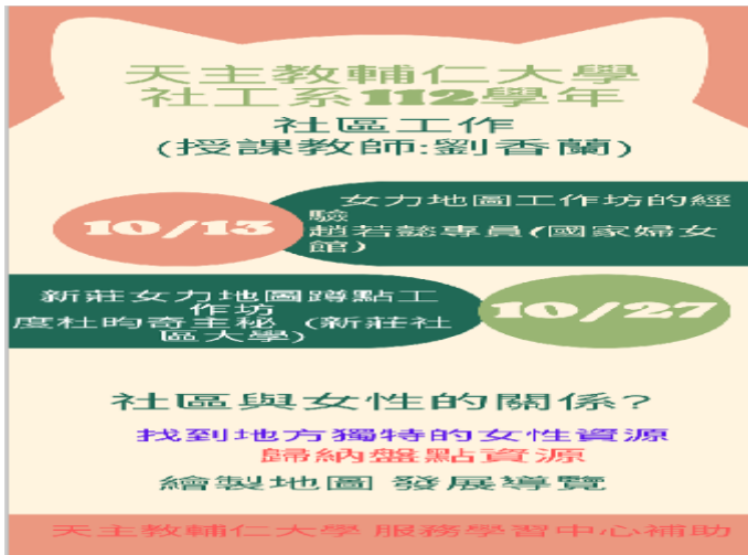
照片 1 說明：海報