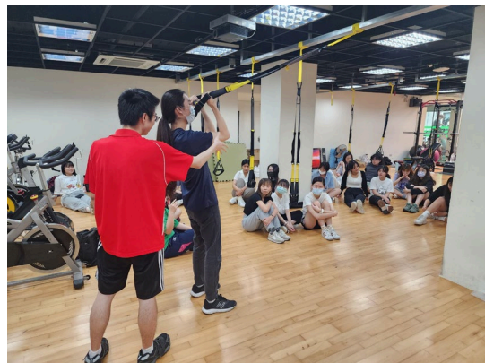
說明：動作分享與教學。