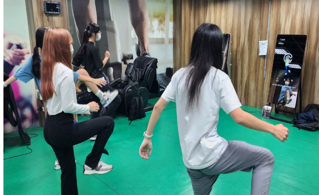
說明：健身魔鏡 zumba 課程。