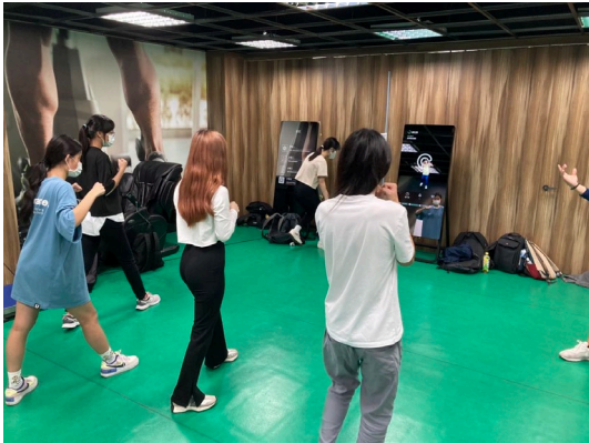
說明：健身魔鏡拳擊課程。