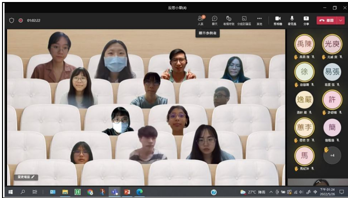
活動結束後的大合照