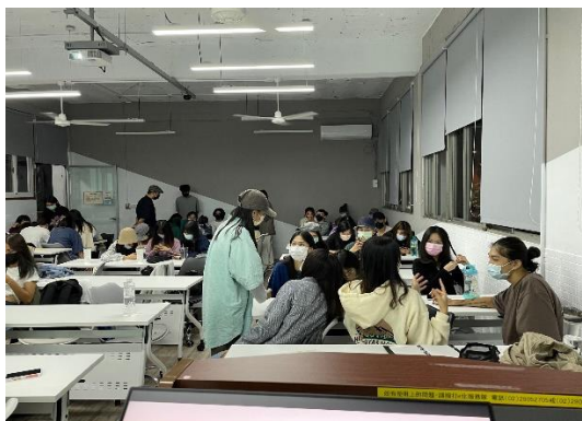
照片 1 說明： 分享會同學討論彼此的心得與經驗