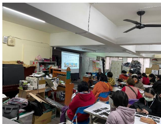
照片 6 說明： 同學觀摩康復之友會為精障學員開設的影片剪輯課程