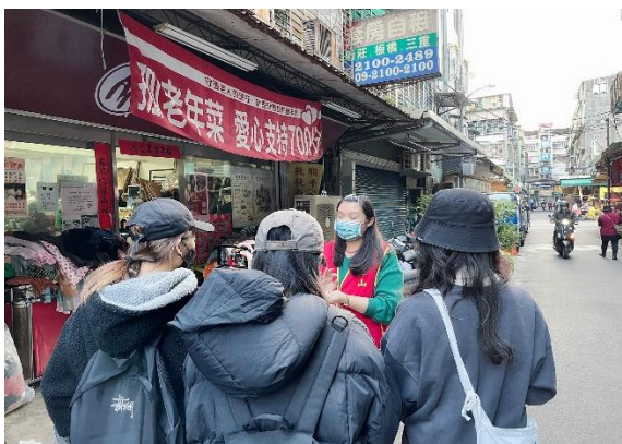
照片 3 說明： 同學們訪拍華山基金會的二手物資小舖