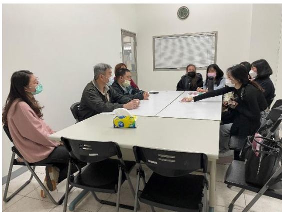
照片 5 說明： 訪拍同學們與康復之友精障學員交談