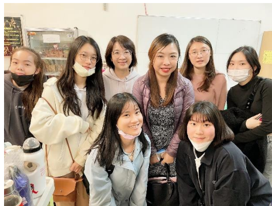
照片 4 說明： 訪拍同學以及老師與康復之友協會溫馨小舖主任 以及工作同仁合影