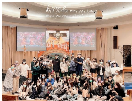
照片 2 說明： 服務前透過基督宗教信仰的精神為同學準備服務的心靈