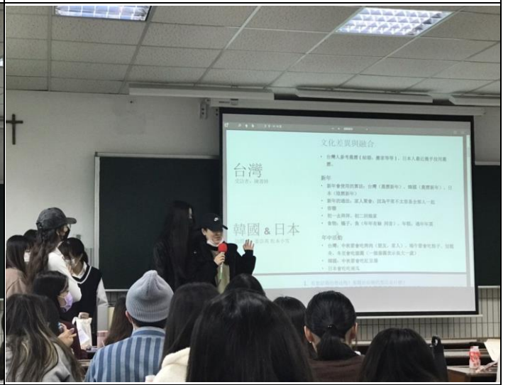
照片 4 說明：成果發表 4