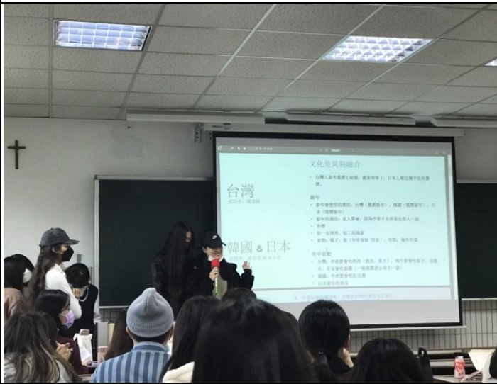
照片 3 說明：成果發表 3