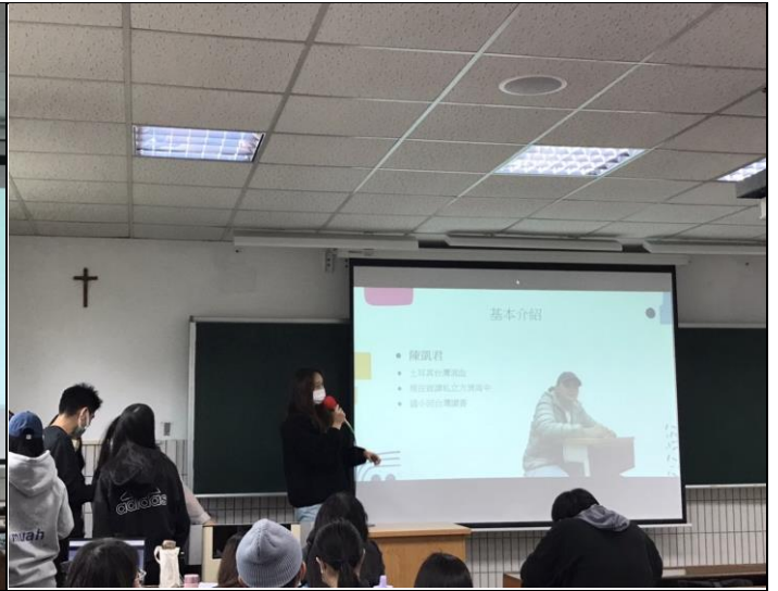
照片 2 說明：成果發表 2