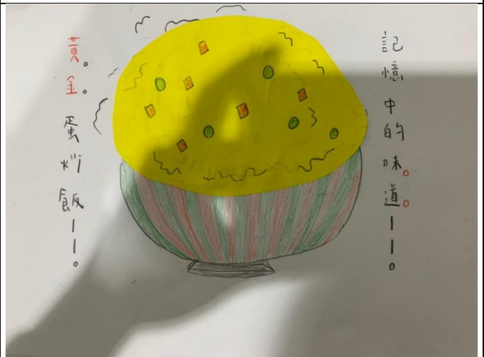
學生作品—拼貼一個家