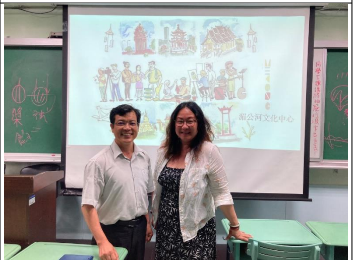
潘老師與講師合照