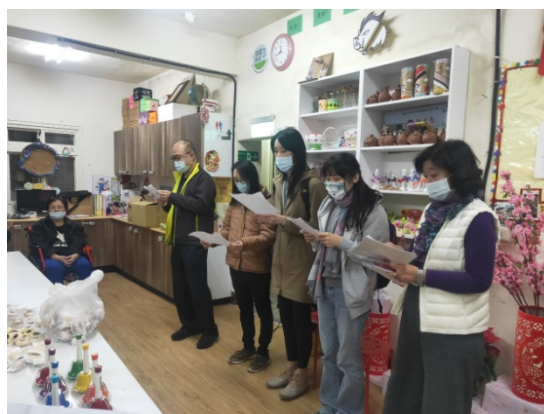
說明：社群教師聖誕獻唱歡樂