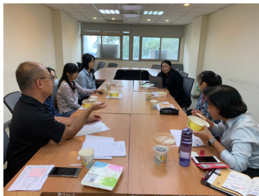
說明：社群會議進行側拍