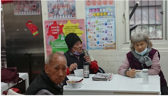
說明：長輩拿麥克風歡樂歌唱