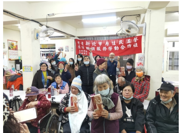
說明：聖誕活動大合照