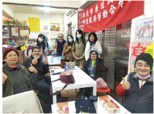
說明：社群與文健站長輩合影