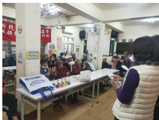
說明：社群教師聖誕獻唱歡樂