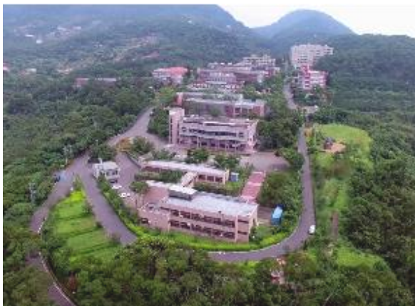
衛生福利部八里療養院空照圖

願景與現況：「新北市衛生福利部八里療養院」以全方位精神醫療園區，心靈健康的世外桃源，實現自我的希望花園－現今醫療消費者的期待愈來愈高，醫療機構資源愈來愈充足，競合關係愈趨複雜，因此該院凝聚共識，再度確認願景為「全方位精神醫療園區，心靈健康的室外桃源，實現自我的希望花園」。然而該院自民國七十八年創立至今已逾三十年，當初興建並無整體景觀療癒的全方位環境規畫，以及建築物面臨老舊現況，院方亟欲景觀建築與環境專業工作者積極投入整題園區環境之改善。此外，療養院所規劃給病患的活動大多為室內活動，但自然環境也是有利於精神障礙者康復的，為此，本課程教學團隊計畫以「八里療養院」導入景觀療癒的空間規劃設計，提升病患在院內的居住品質，增加外部活動空間，並且以療癒景觀、園藝治療等手法結合原有的醫療，幫助病患康復為目的，提出具體的理想景觀規劃設計方案 落實教學相長以及景觀治療論述之教學理論實踐。