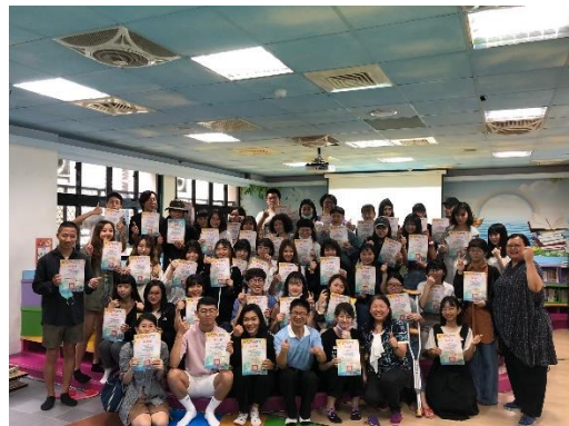
說明：頒發感謝狀合影