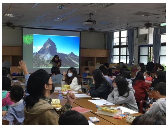
說明：家長分享旅行經歷