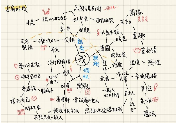
說明：大學生美感經驗回顧