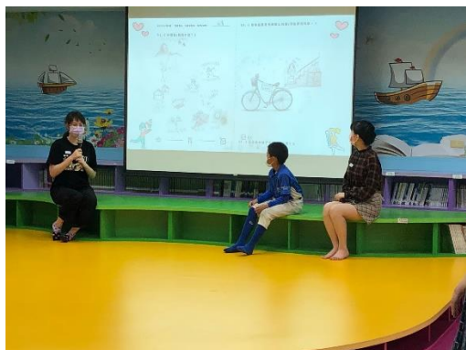
說明：大學生與小朋友的分享