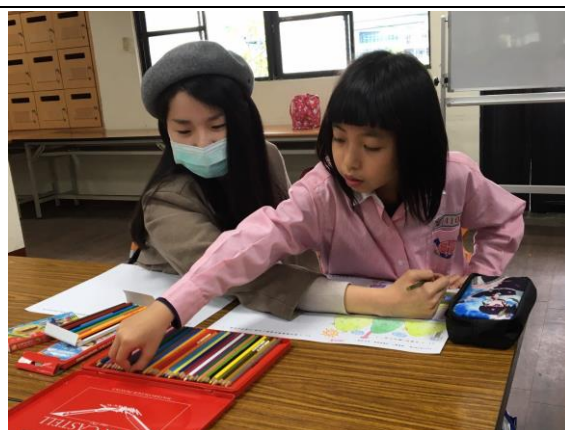
說明：大學生與小朋友創作學習單