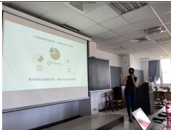
開放博物館專員演講