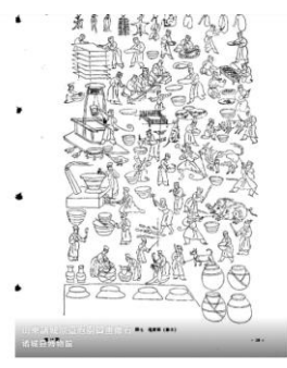
漢代燒烤吃哪些肉類？ 以山東諸城漢墓庖厨圖畫像石為例，我們可以從這一整幅圖中看出許多不同的肉類。下面讓我們一起放大圖片，找找看圖中都有哪些動物吧~