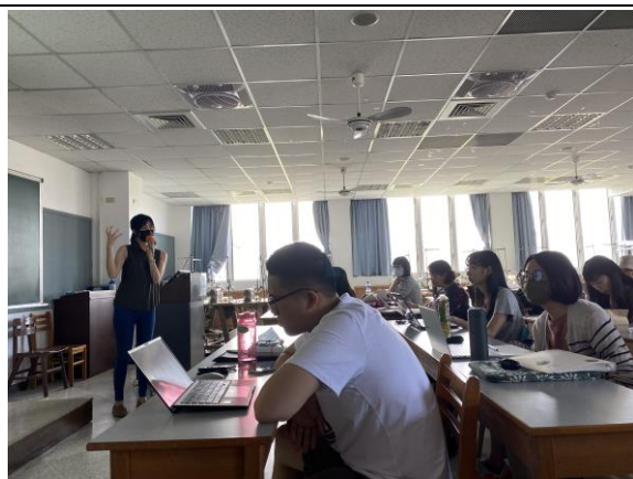
博館所學生聆聽開放博物館專員演講