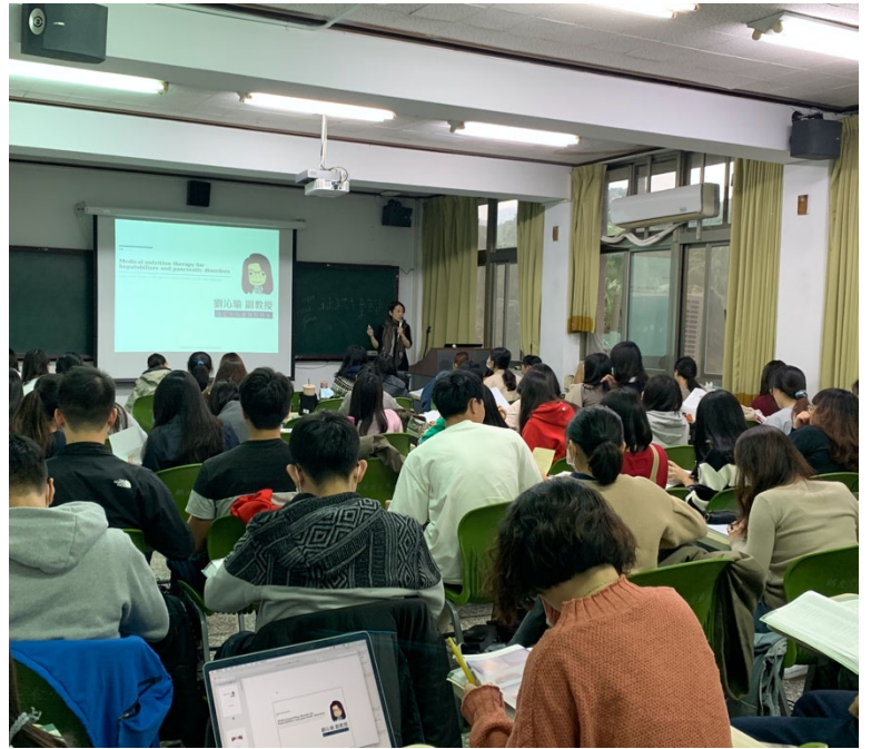
圖片說明：老師在備課當中加入自身的臨床工作經驗，適時提醒同學未來實習過程中可能需要注意的地方。