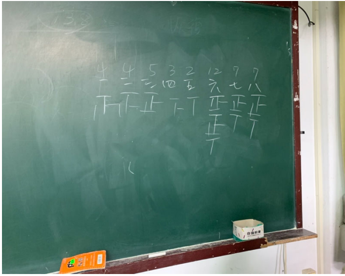
圖片說明：透過分組的方式，提出問題及回答問題進行加分使沈悶的課程更活潑生動。