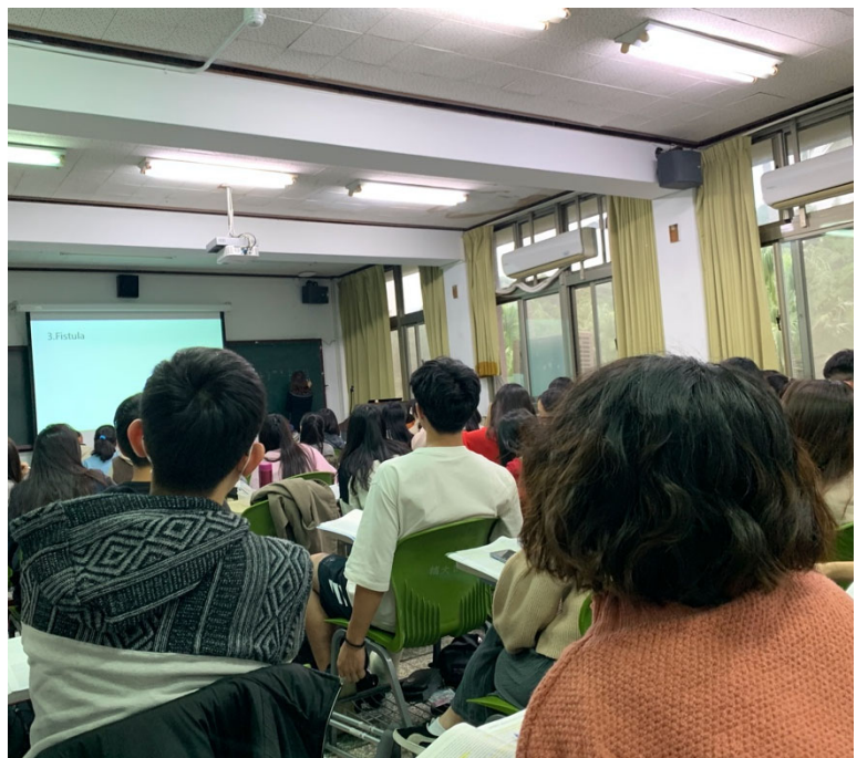
圖片說明：老師課堂上提出的問題，各組踴躍地回答，由此也能感受到同學們的學習心態。