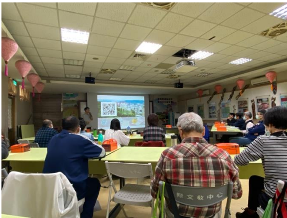
照片 1：活動 1 當日照片

說明：北台都會水圳再生與地方創生交流 (下新莊文化與水文部分)，由各單位與參與者進行討論