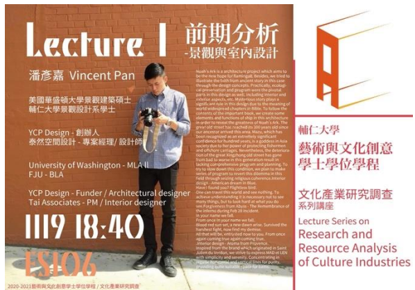
照片 2：活動 2 宣傳海報

說明：北台都會水圳再生與地方創生交流 (下新莊文化與水文部分)，由各單位與參與者進行討論