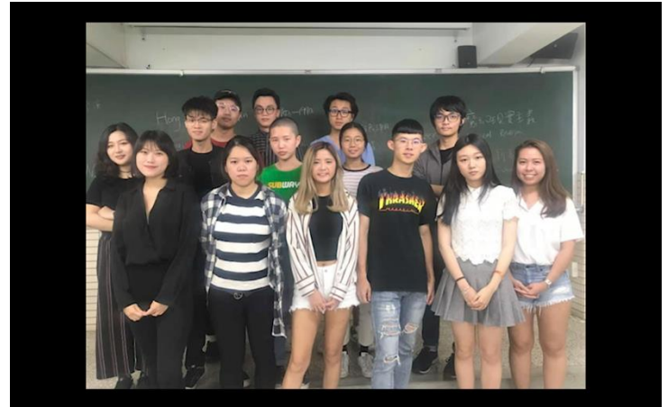
圖片說明：學生課堂上台以英語分享華語電影史觀點