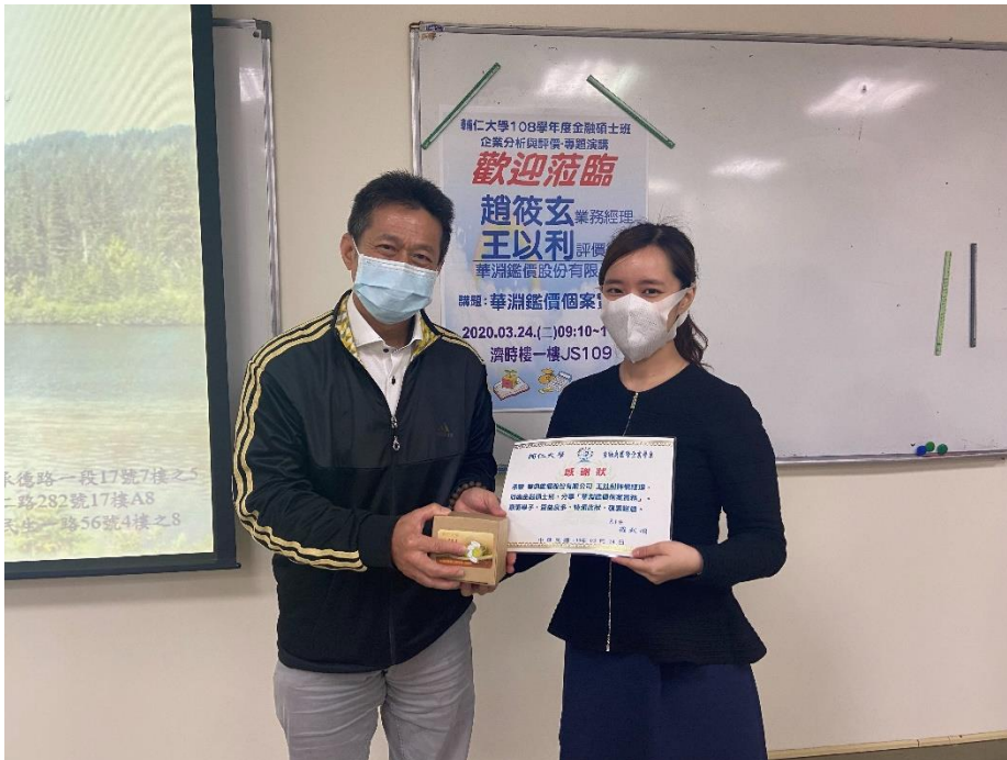
華淵鑑價業師分享其工作內容與介紹評價方式