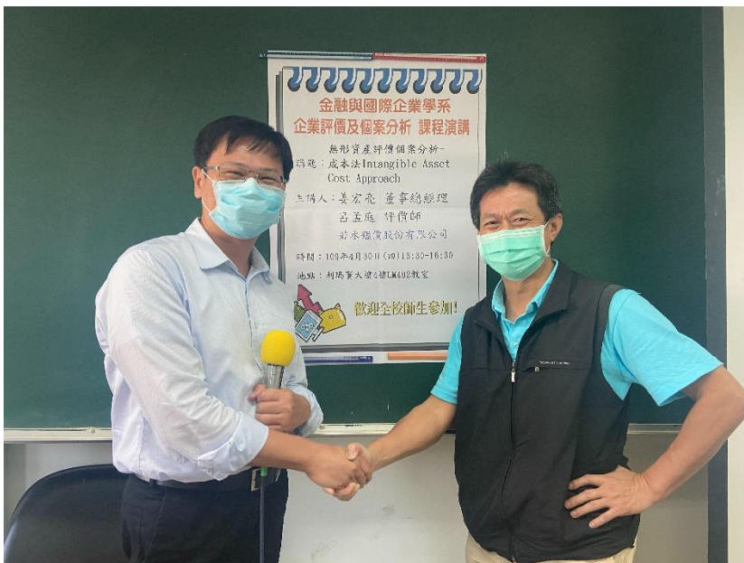
若水業師分享有關評價方式 - 成本法