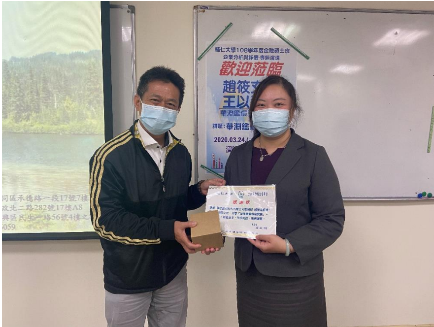
華淵鑑價業師分享其工作內容與經歷心得