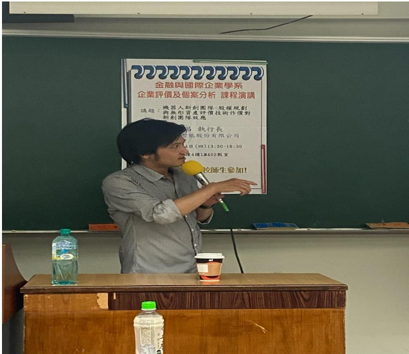
業師分享其創業心得與心路歷程