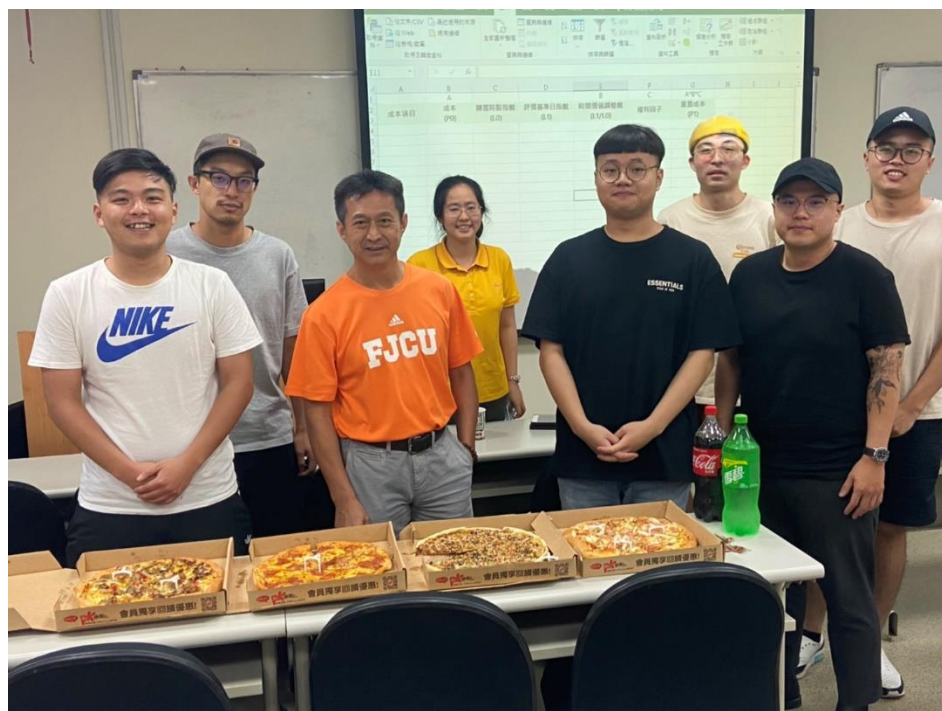
自主學習課程中老師與部分學生合照