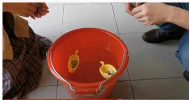
學生設計之捏黏土放銅板比賽活動