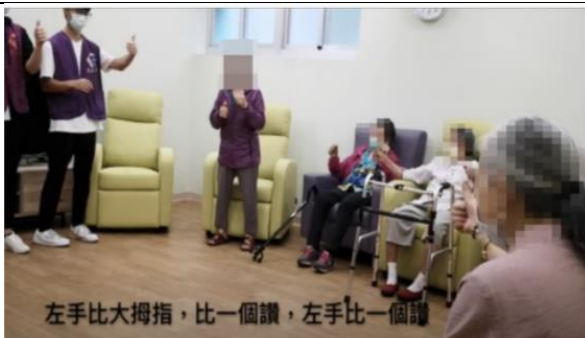
學生在公共托老中心活動(含認知元素)