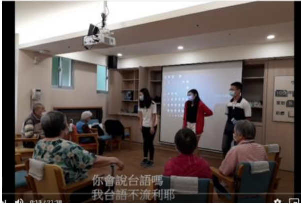
學生在公共托老中心活動之暖場