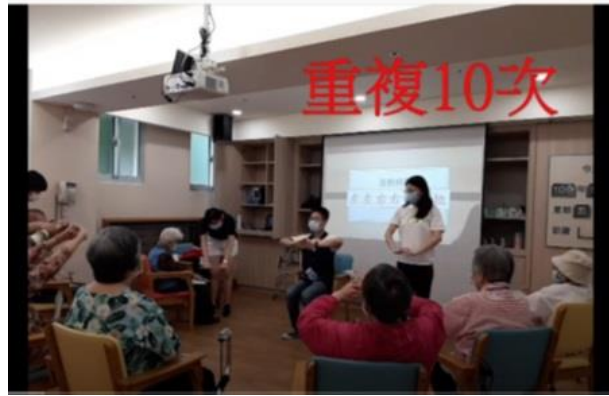
學生在公共托老中心活動之肢體運動