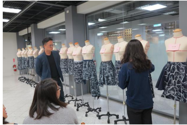
Figure 2 期中審查業師與學生交流講評。