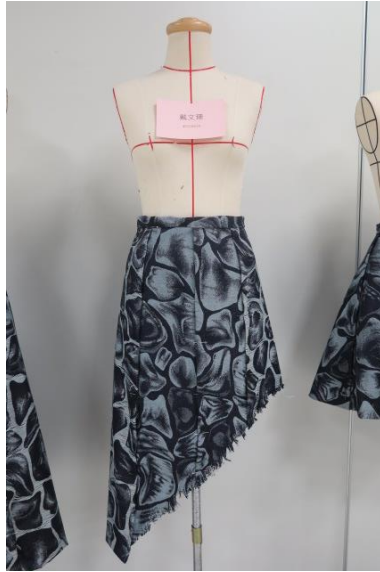
Figure 8 學生戴文珊創作，使用不對稱剪裁，加上抽紗鬚邊技法。