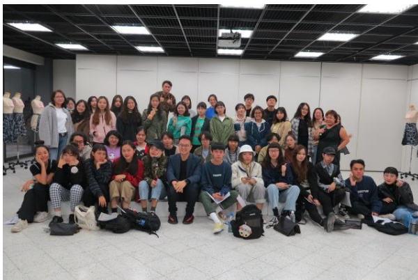
Figure 5 講評後講師與全班同學合影。