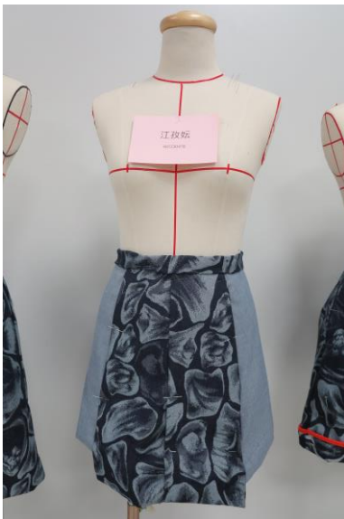
Figure 10 學生江孜妘創作，對稱設計加上同色系剪接片效果。