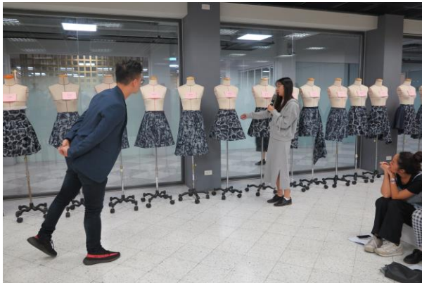
Figure 3 學生向業師說明創作理念。