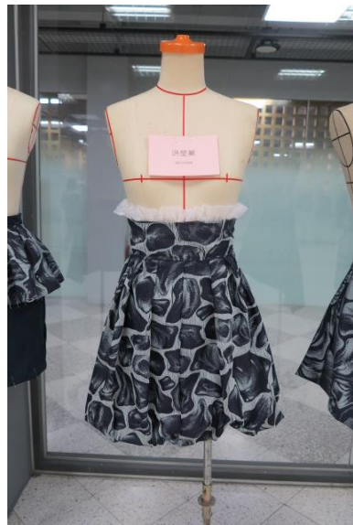
Figure 12 學生洪瑩蓁創作，高腰設計，搭配紗裝飾與抽皺裙襬營造少女風格。