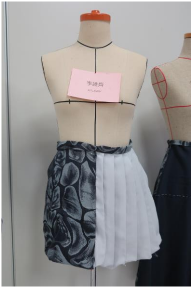
Figure 7 學生李睦齊創作，搭配單向刀褶技法、撞色設計。

(3) 學生成果：期中審查作品共 41 件，此處挑選 6 件說明其特色與技法，其餘附於後頁表格