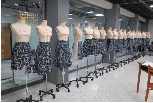
Figure 1 學生使用業界提供特殊布料創作。