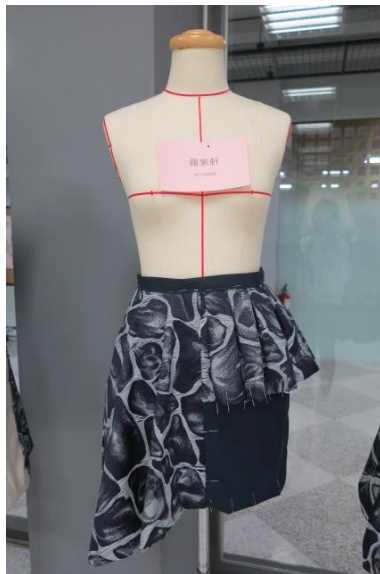
Figure 11 學生羅紫軒創作，同色系深色底裙，加上不對稱設計與腰部波浪剪接片。