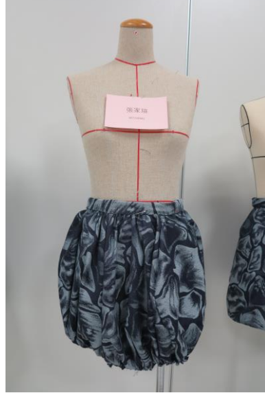
Figure 9 學生張家瑄創作，搭配抽皺技法，創造燈籠裙輪廓。