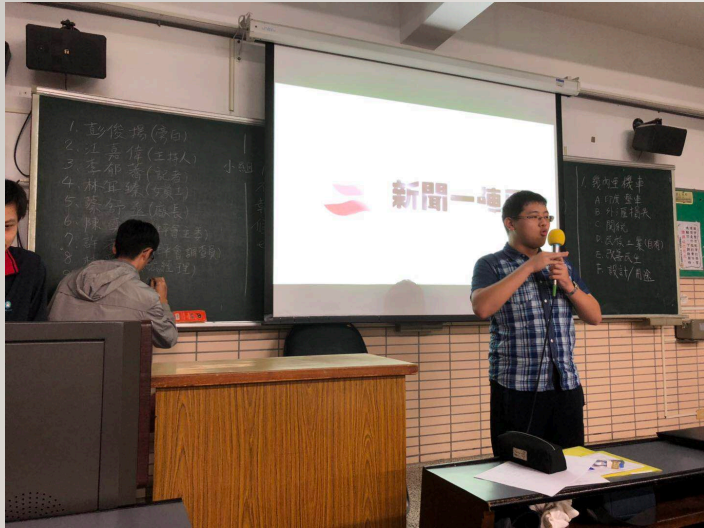
Fig.6 學生上課期間發表議題