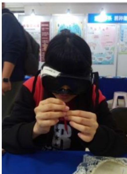
說明：現場體驗視力老化穿針引線之不易