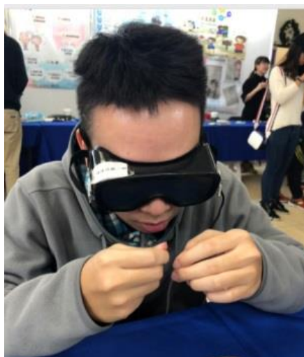
說明：體驗視力老化的穿針引線非常認真。