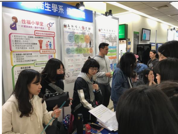
說明：好運滾滾來壞孕不要來，衛教現場