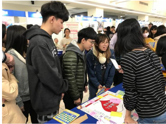
說明：認識危險情人大富翁遊戲，闖關者正在聆聽題目