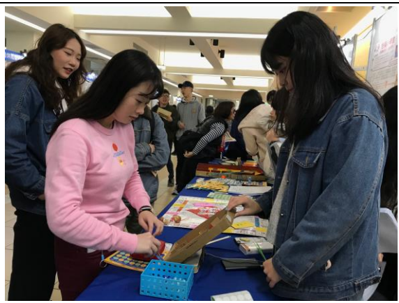
說明：命運好好玩，用彈珠台選擇問題