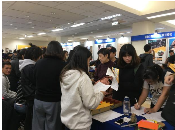
說明：闖關者填寫回饋單