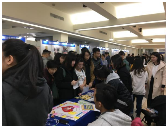
說明：民眾踴躍參與