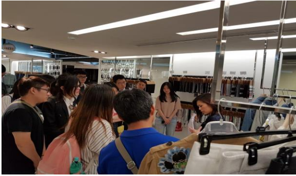
台南企業內部參觀