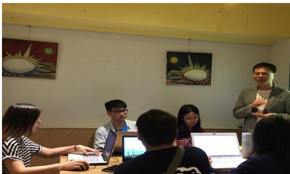
姜總經理做併購評價介紹