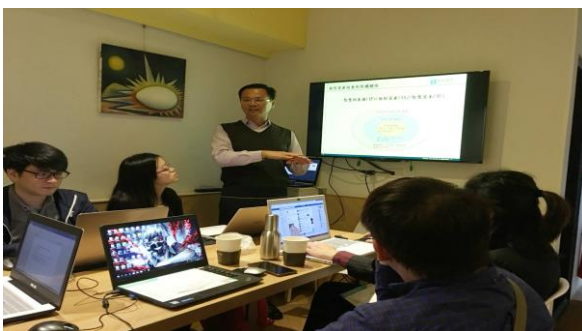
業師姜總經理授課(1)