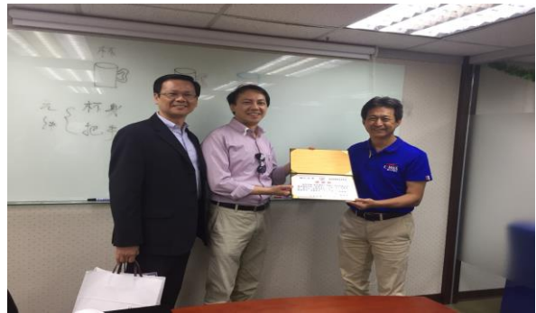
業師、老師與陳總經理合照