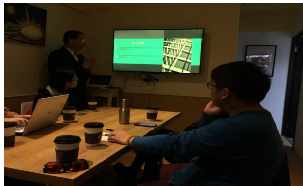
姜總經理介紹評價概念