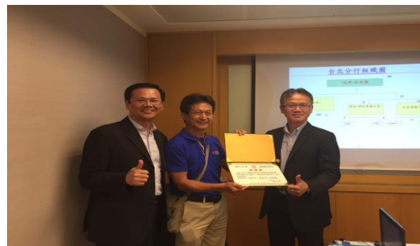
業師、老師與林總經理合照