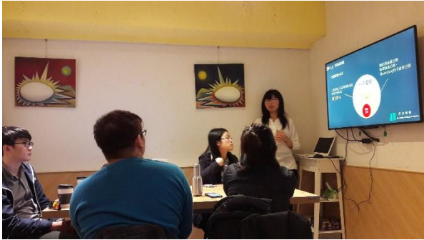
(二) 同學們聆聽課程