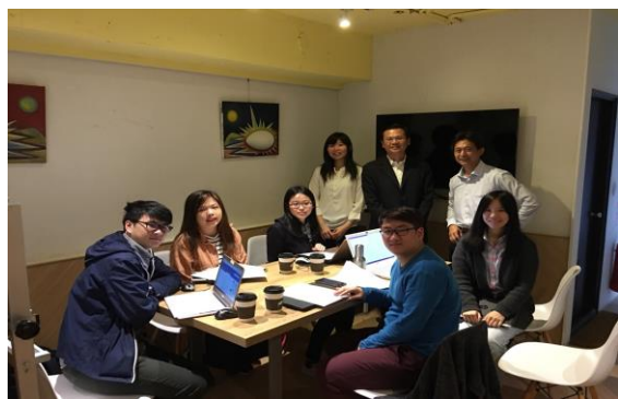
課後與姜總業師合照