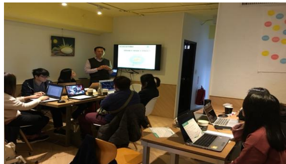
業師姜總經理授課(2)