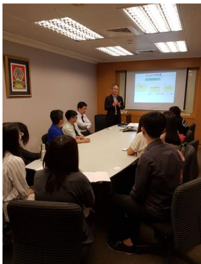
林總經理做企金介紹