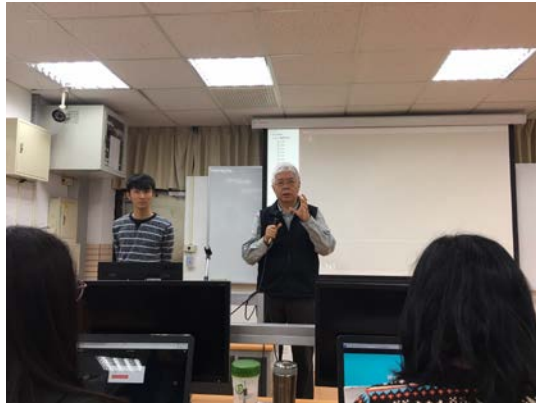
梅主任介紹下午場內容