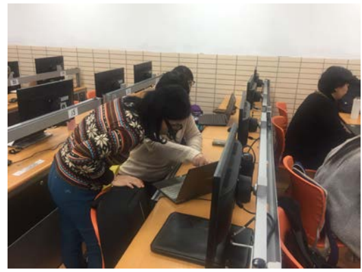
與會者互相交流程式碼